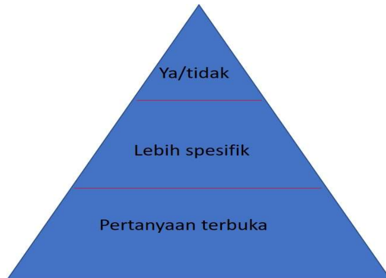
Gambar 4.2 Ilustrasi dalam bobot pertanyaan dengan Auditee di Prodi

akan mendapatkan jawaban dari Auditee , berupa: Ya / Tidak. Pertanyaan dengan jawaban tersebut dapat dilanjutkan dengan pertanyaan yang lebih spesifik, dan juga dapat dikembangkan dengan pertanyaan terbuka. Jawaban atas pertanyaan yang telah dibuat dalam daftar checklist menunjukkan bobot pertanyaan. Gambar 4.2 berikut ini merupakan ilustrasi bobot pertanyaan terhadap auditee . Auditor berusaha untuk mengembangkan pertanyaan sehingga akan memperoleh kejelasan jawaban sehingga akan dapat disimpulkan temuan – temuan.